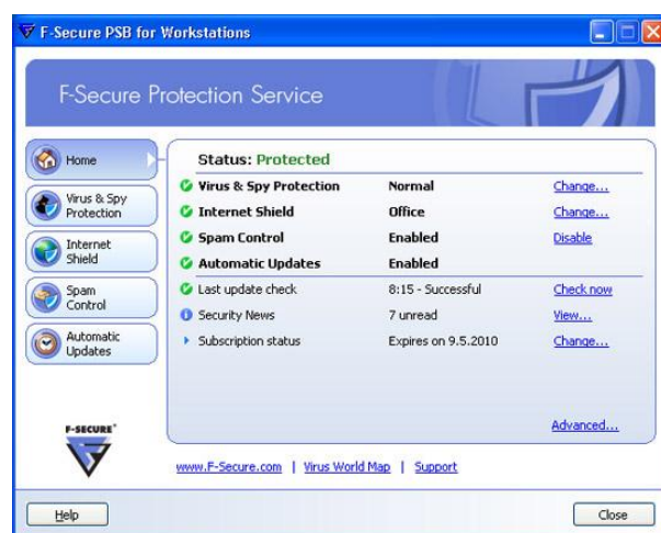
F-Secure PSB szoftver munkaállomásokra