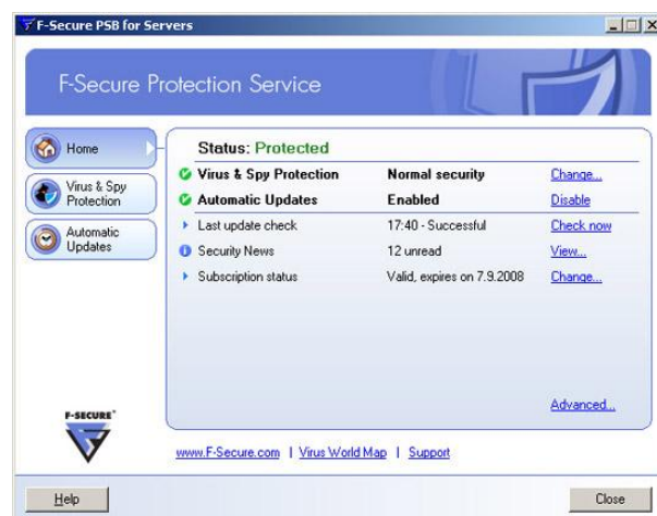
F-Secure PSB szoftver szerverekre