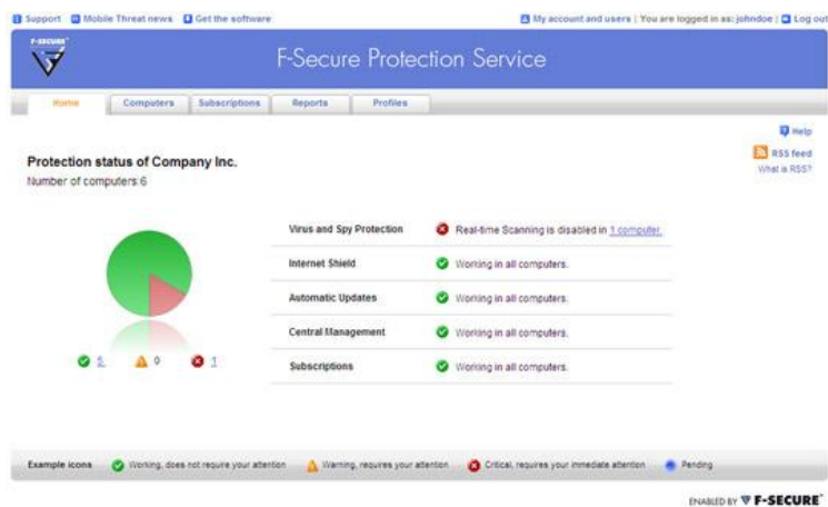
F-Secure PSB portál főoldala

Az F-Secure PSB segítségével szoros kapcsolat alakulhat ki a vevő és a szolgáltató között, amely további szolgáltatások értékesítésére kínál remek táptalajt. A rendelkezésre álló szolgáltatások a szolgáltatótól függenek, lehet például szoftvertelepítés és beállítás, rendszeradminisztráció, korlátokat csak a szolgáltató fantáziája és felkészültsége szabhat. A szolgáltató így kezelheti a vevő rendszerének biztonsági beállításait, továbbá jelentéseket is készíthet róla. Az átfogó szolgáltatásokkal a partnere összes informatikai igényét ki tudja elégíteni.